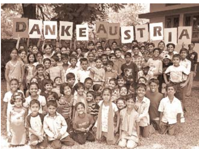
Mit diesem Foto bedankten sich die indischen Kinder für die Spendengelder aus dem Patenlauf.

Eine Bergmesse fordert Überwindung und Mühe, belohnt aber mit einer intensiven Naturerfahrung und einer herrlichen Aussicht auf die Bergwelt