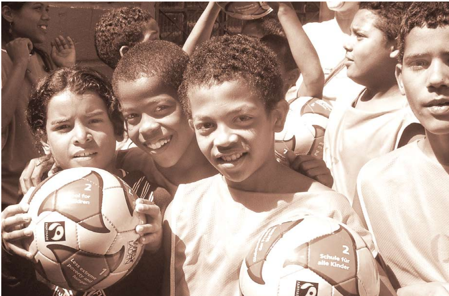
Sport als Segen: Das Hilfswerk „Jugend Eine Welt“ setzt sich für faire Produktionsbedingungen in der Sportartikelindustrie ein und initiiert Fußballschulen, um Kindern in Ländern der Dritten Welt ein Leben in Würde zu ermöglichen.