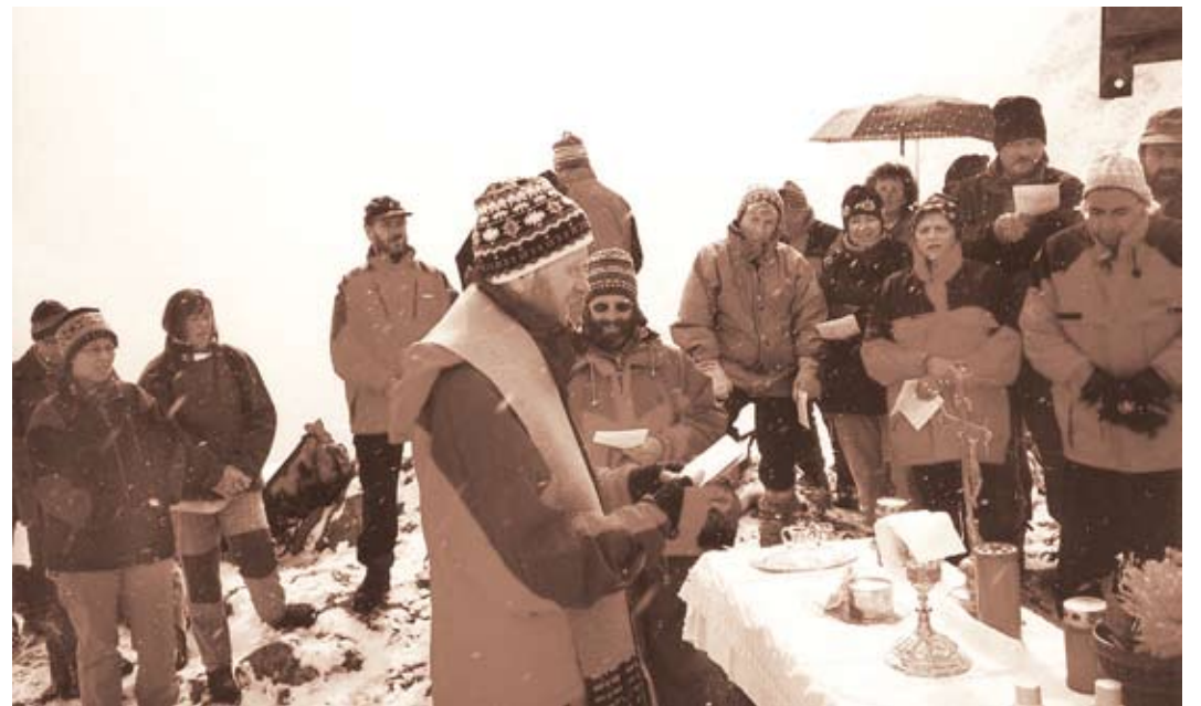
Auch bei widrigen Wetterverhältnissen (wie hier am Thialkopf) wird der Gottesdienst auf dem Gipfel zu einem prägenden Erlebnis.

Bergmessen mit Karl Plangger: 29. Juni: Vorderes Pitztal/Wald i. P.; 19. Juli: Hochstuba/Hütte/Sölden; 31. August: Flauring-Joch/Flauring; 7. September: Thialkopf/Landeck. Nähere Auskünfte erteilen die Tourismusbüros der genannten Orte.