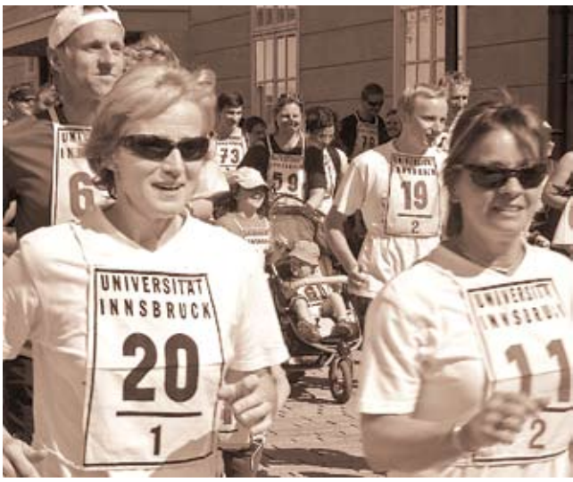
Jung und Alt spulen bei den Patenläufen Kilometer ab, um für Menschen in Not zu sammeln.